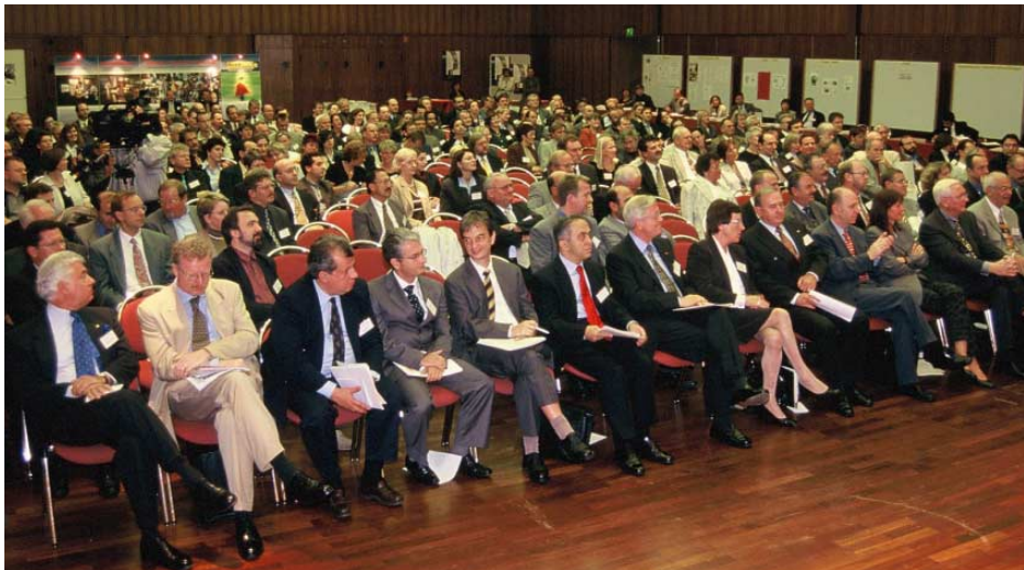
Eröffnungsveranstaltung KAUSA 1999 im Börsensaal der Industrie- und Handelskammer zu Köln

Unternehmen mit Inhabern ausländischer Herkunft sind in den vergangenen 15 Jahren zu einem wichtigen Teil der deutschen Wirtschaft geworden. In Deutschland gibt es hiervon 300.000 Unternehmen 1 , darunter allein 60 000 Unternehmer türkischer Herkunft. Um das Potenzial an Ausbildungsstellen in dieser Unternehmergruppe verstärkt zu nutzen, koordiniert und unterstützt KAUSA deutschlandweit alle Institutionen, Projekte und Initiativen, die in diesem Feld tätig sind.