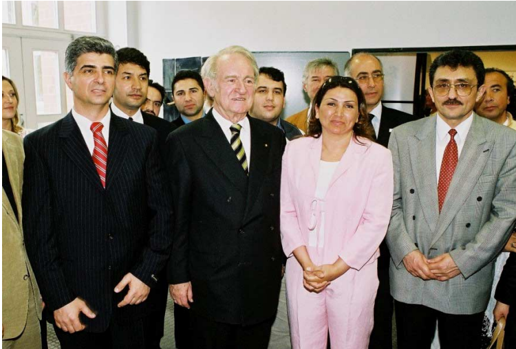
Der damalige Bundespräsident Johannes Rau mit Unternehmern in einer Schule in Berlin 2004