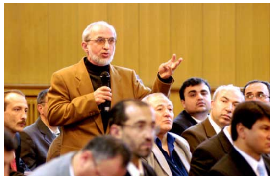
Für viele eine neue Idee: Berufsbildung als Thema der Jugendarbeit der Moscheengemeinden