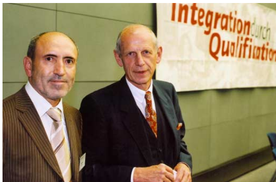
Kemal Sahin (links), Präsident der Türkisch-Deutschen Industrie- und Handelskammer, und Ludwig Georg Braun, Präsident des Deutschen Industrie- und Handelskammertages, bei der Medientagung „Integration durch Qualifikation“ im Juni 2003 in Berlin

Ein wichtiger Bestandteil der Öffentlichkeitsarbeit ist auch die direkte Zusammenarbeit mit den Medien. In Deutschland gibt es rund 2800 nichtdeutsche Printerzeugnisse sowie