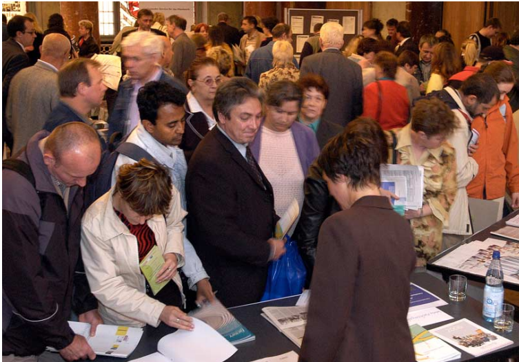
Russischsprachige Berliner informieren sich an diversen Informationsständen im Wappensaal des Roten Rathauses

Deutschland, RUS MEDIA GmbH, eine Informationskampagne gestartet. In mehreren regionalen Ausgaben der Wochenzeitung Russkaja Germania und über das Radio Russkij Berlin wurden im Sommer 2004 entsprechende Informationsbeiträge verbreitet, die in Zusammenarbeit mit den Journalisten der Zeitung und des Radios erarbeitet worden waren. Diese Informationsreihe war auch mit einer Höreraktion verbunden,